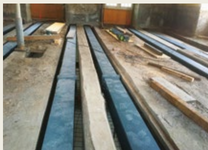
Le plancher du premier étage où les anciennes poutres en bois sont renforcées par des éléments métalliques.