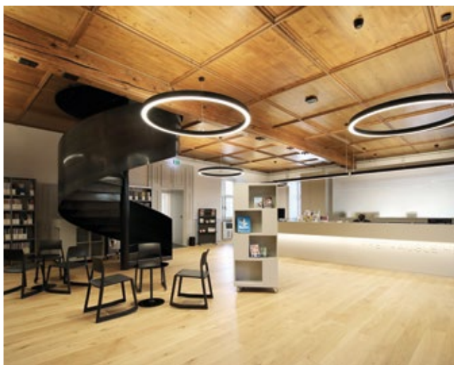
Le lieu d'accueil et de distribution