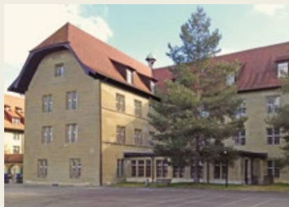
Le site : la bibliothèque-médiathèque occupe le rez-de-chaussée et le 1 er étage de cette partie du bâtiment.