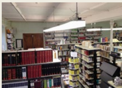
L'encombrement dans l'ancienne bibliothèque.